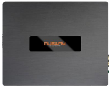
Musway M6V3 Forsterker Ferdig konfigurert til bilen