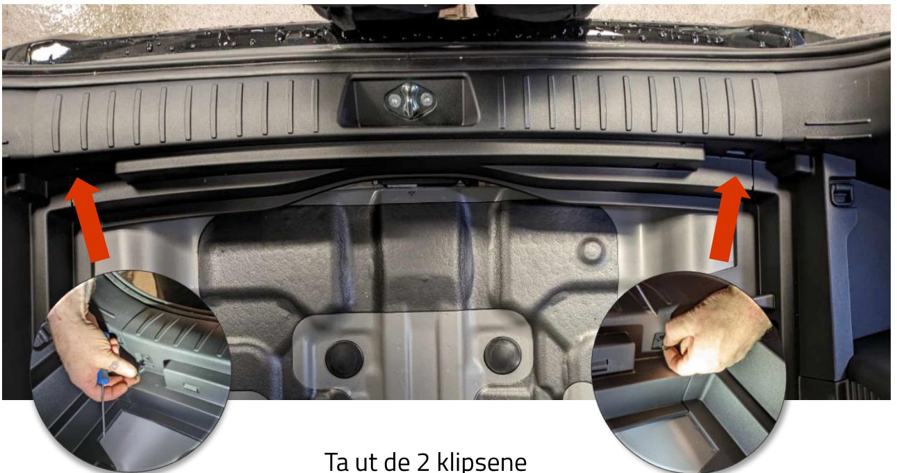
Ta ut de 2 klipsene