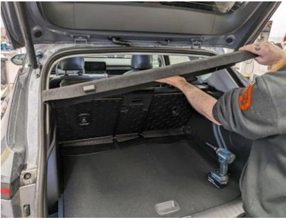
Ta ut hattehyllen