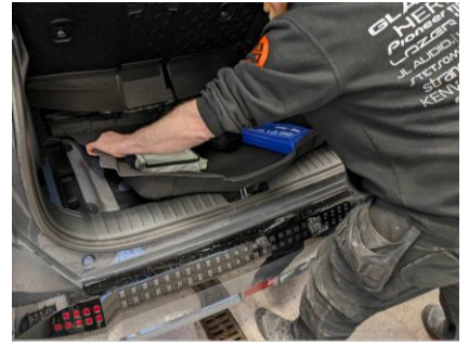
Ta ut bagasjeromsteppe