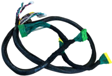
BRS Plug & Play kabelsett