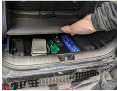
Ta ut gulvplate