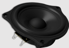
ohne Adapterrahmen without mounting frame