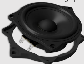
mit Adapterrahmen unten bottom-mounted frame