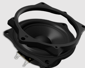
mit Adapterrahmen oben top-mounted frame